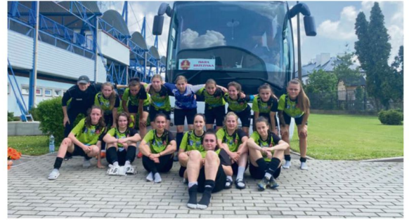
Po pięciu kolejkach piłkarki KKPNI Iskry Brzezinka otwierają trzecioligową tabelę. Brawo!

„Iskierki” mogły się pokusić się o zgarnięcie pełnej puli. Po strzale jednej z piłkarek z Brzezinki z pomocą miejscowym przyszła poprzeczka. Nie obyło się też bez kontrowersyjnej