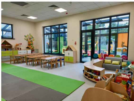
Dzieci z Brzezinki od września mają nowe przedszkole.

W tym roku jest z kolei nieco więcej przedszkolaków. W ubiegłym było ich 594, teraz jest 608 dzieci. Tę zmianę najbardziej widać w Brzezince (rok temu było 73, a od września jest blisko sto maluchów), gdzie prawdopodobnie zadziałała pokusa nauki w nowo wybudowanym przedszkolu.