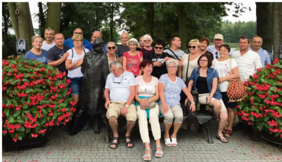
Członkowie grojeckiego Stowarzyszenia przy Ławeczce Wisławy Szymborskiej w Kórniku.