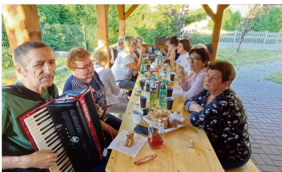
Integracja pod altaną w Brzezince.

Pod koniec sierpnia wybrali się do Niepołomic. Zwiedzili Zamek Królewski nazywany „drugim Wawelem” i Małopolskie Centrum Dźwięku i Słowa, gdzie każdy mógł odsłuchać płytę wybraną z kolekcji dwóch tysięcy albumów. Odpoczywali przy „Autorskiej zupie Króla Sasa”. Obejrżeli potem neogotycki ratusz i gotycki kościół Dziesięciu Tysięcy Męczenników. W drodze powrotnej wstąpili do opactwa Benedyktynek w Staniątkach. Wycieczka była niezwykle udana, chociaż odrobinę wyczerpująca.