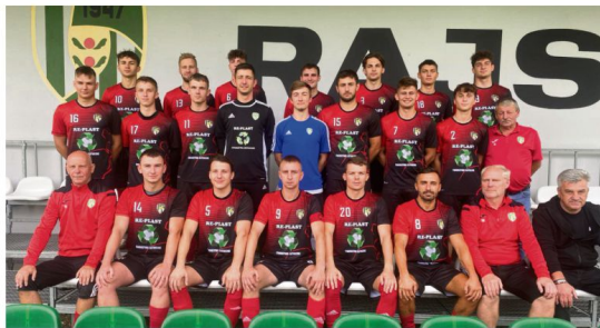
Po ośmiu kolejkach rozgrywek ligi okręgowej LKS Rajsko zajmuje dziewiąte miejsce z dorobkiem 11 punktów.