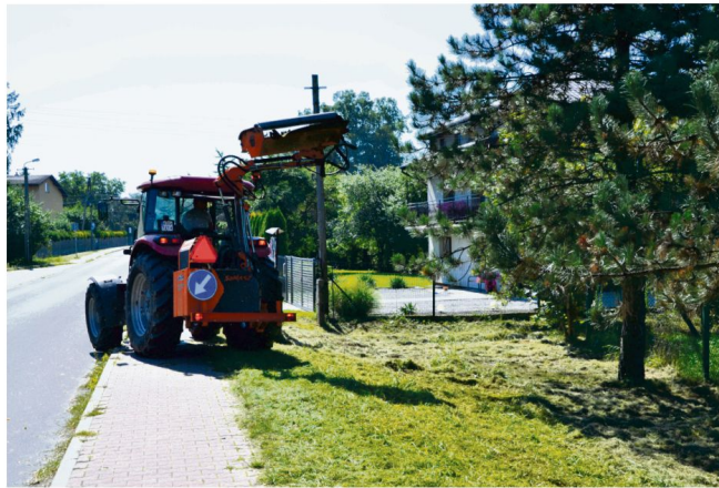
W tym roku pracownicy ZKGO po raz kolejny kosili pobocza gminnych dróg i tereny zielone. Prezes Tomasz Matula przestrzegł, że w 2024 Spółka nie będzie miała potrzebnych do tego maszyn.

wymianę zużytych i niedostosowanych do specyfiki prac komunalnych traktorów oraz koparki. To spowoduje wycofanie się Spółki z ubiegania się o prace związane z ośnieżaniem dróg gminnych, a w roku następnym z koszeniem terenów i dróg gminnych”.