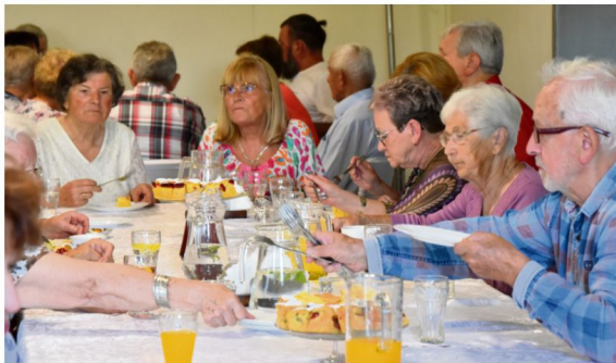
Biesiada Seniorów w Zaborzu.