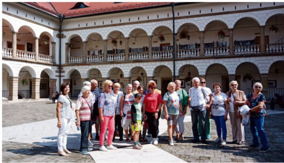
Zaborscy seniorzy w Zamku Królewskim w Niepołomicach.

Członkowie Klubu Seniora w Zaborzu jeżdżą na wycieczki i uczą się aktorstwa. Owocem warsztatów teatralnych będzie przedstawienie dla przedszkolaków.