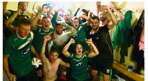
Radość w szatni Iskry Brzezinka po zwycięstwie w Zatorze nad Zatorzanką.

Dwanaście punktów w siedmiu meczach zgromadził Puls Broszkowice (VI miejsce). W siódmej serii broszkowiczanie pewnie pokonali na swoim terenie Skawę Podolsze 6:2. Cztery „oczka” mniej od Pulsu ma LKS Poreba Wielka (IX miejsce), która w siódmym meczu straciła ...siedem goli, ulegając w Polance Wielkiej liderowi 7:1. Na pozycjach od dziesiątej do dwunastej znajdują się odpowiednio Solavia Grojec (6 pkt),